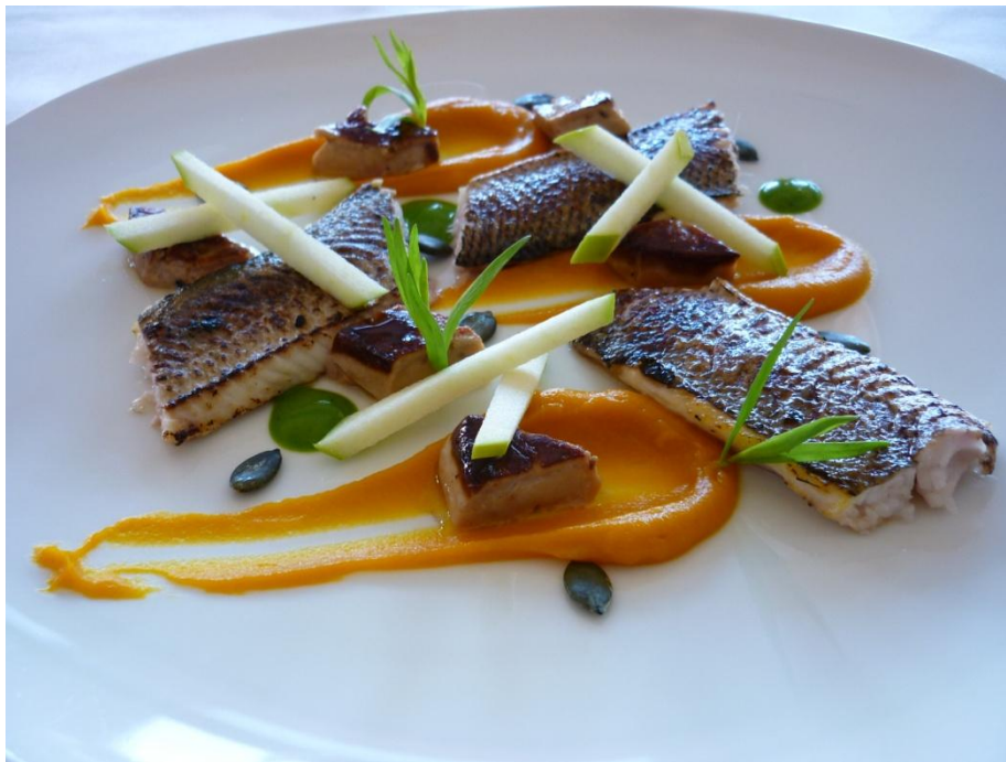
Lavarello del Garda su purea di zucca al cardamomo, foie gras e mela verde